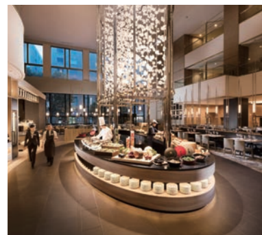
ロビー階に位置する開放的な オールデイダイニング「インプレイス3-3」

世界展開を続けるヒルトン・ホテルズ&リゾーツのホテルの一つとして1989年に名古屋市内初の外資系ホテルとして誕生。「ヒルトンスタンダード」といわれる高水準のサービスを誇るファーストクラスのホテル。