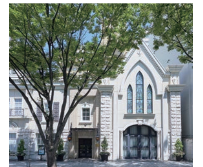
広小路通から望む英国調コロニアル 建築のホテル外観